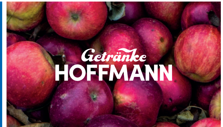
Einfarbiges, weißes Logo auf Bildmotiv