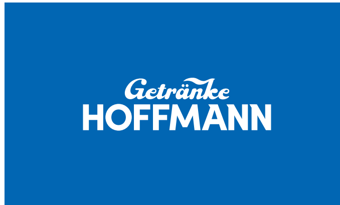
Einfarbiges, weißes Logo auf einfarbigem Hintergrund