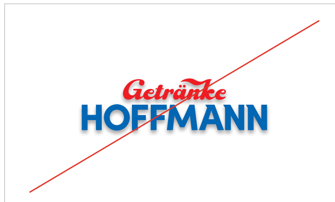
Keine Schattierungen oder andere Effekte