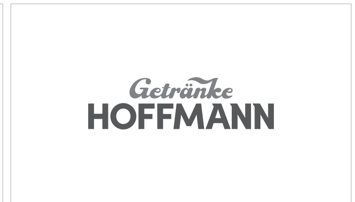
Graustufen-Logo, bestehend aus 60% und 80% Schwarz