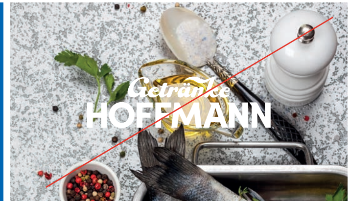
Keine Anwendung auf unruhigen / unleserlichen Hintergründen