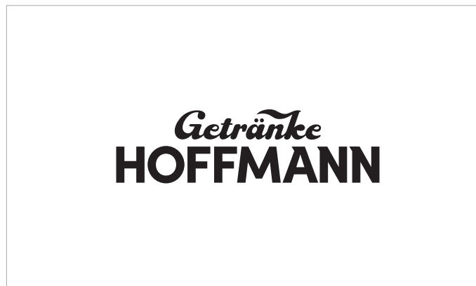
Einfarbiges, schwarzes Logo für Faxe und monochrome Publikationen