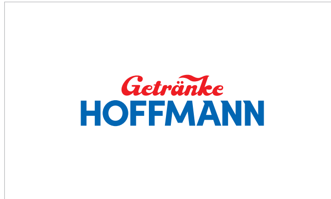
Standardlogo, farbig auf weißem Hintergrund

Bei einfarbig weißem Logo auf Bildmotiven gilt: Die verwendeten Bildmotive müssen gewährleisten, dass das Logo deutlich und gut sichtbar darauf erkennbar ist. Die Bildmotive dürfen somit keine negativen Auswirkungen auf das Logo haben.