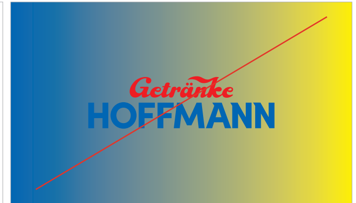
Kein Logo auf Farbverläufen