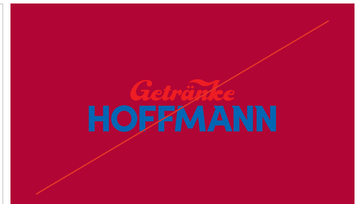
Keine unleserlichen/disharmonischen Farbhintergründe