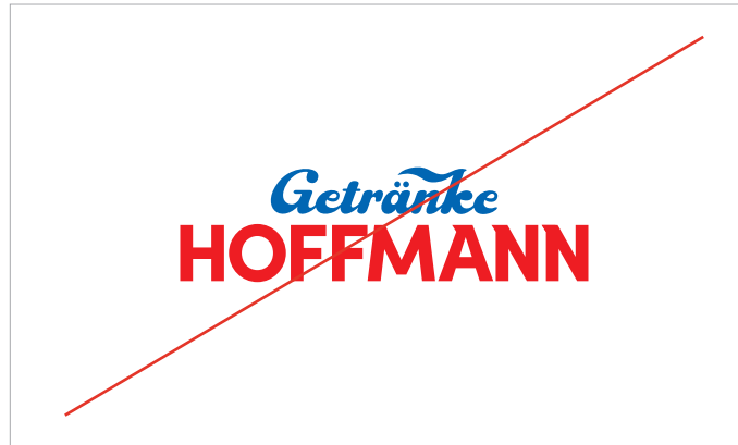
Keine Farben tauschen oder andersfarbig umfärben

Unsere Logos dürfen weder modifiziert noch anderweitig als in diesem Handbuch definiert angewendet werden. Nebenstehend sind einige Beispiele für Verbote aufgeführt.